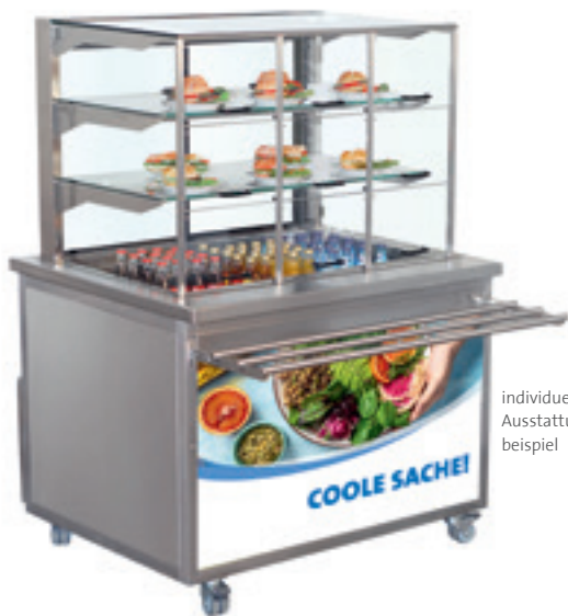
individuelles Ausstattungs- beispiel