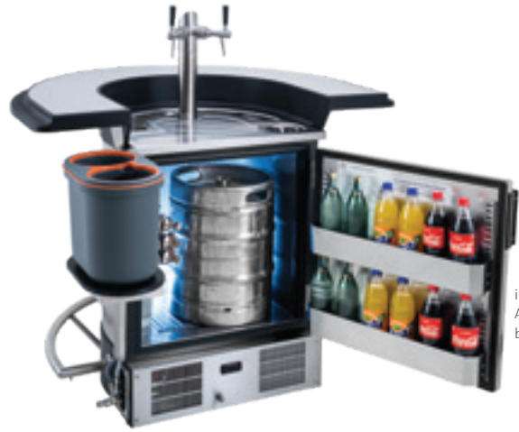
individuelles Ausstattungs- beispiel