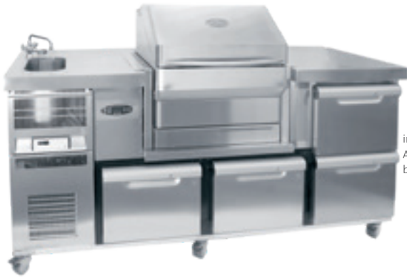
individuelles Ausstattungs- beispiel